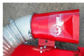
Salida manga de aire