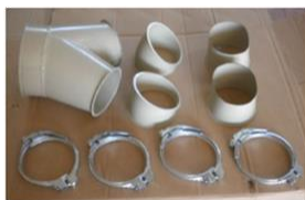
Diversos Codos y Abrazaderas