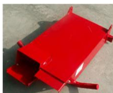
Extencion doble salida