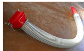
Extencion manga de aire