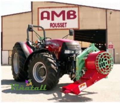
TURBINE T3P AVANT T3P0003