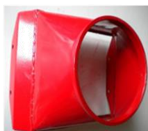
Adaptación manga de aire