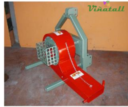
TURBINE T3P ARRIERE T3P0001